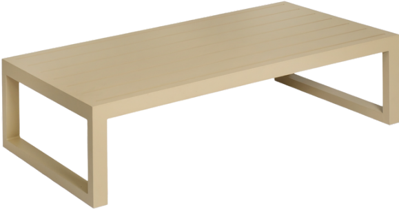
Sehpa(Alüminyum Yüzeý)/Aluminum Coffee Table