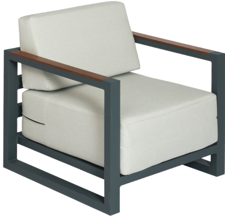
Tekli Koltuk/Single Seat