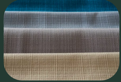
OLEFİN DIŞ MEKAN KUMAŞ