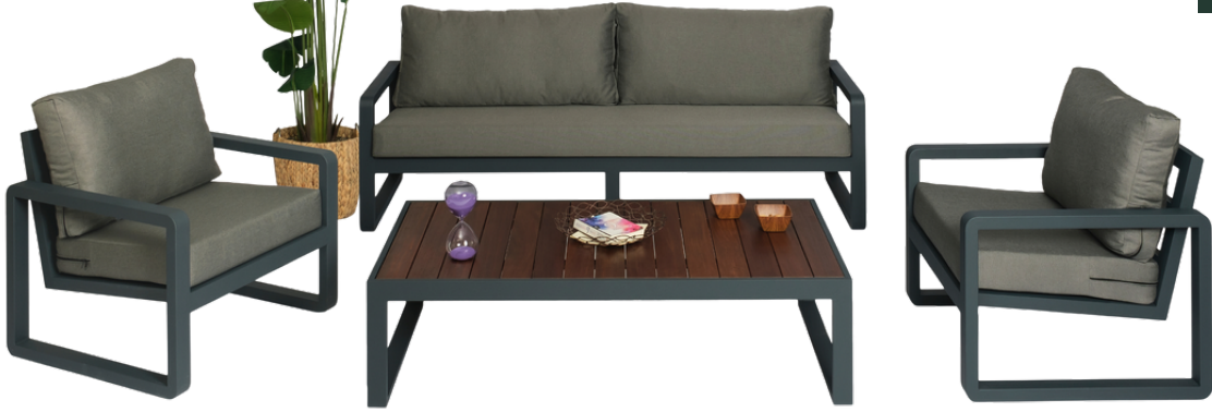
Vondesa Abant 3-1-1 Koltuk Takım İroko Sehpa