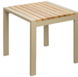
İroko Şezlong Sehpaşı/Table