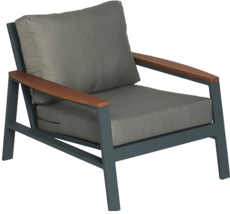
Tekli Koltuk/Single Seat