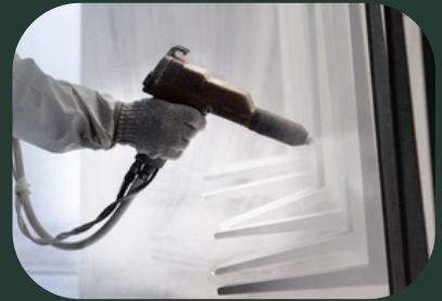
ELEKTROSTATİK TOZ FIRIN BOYA