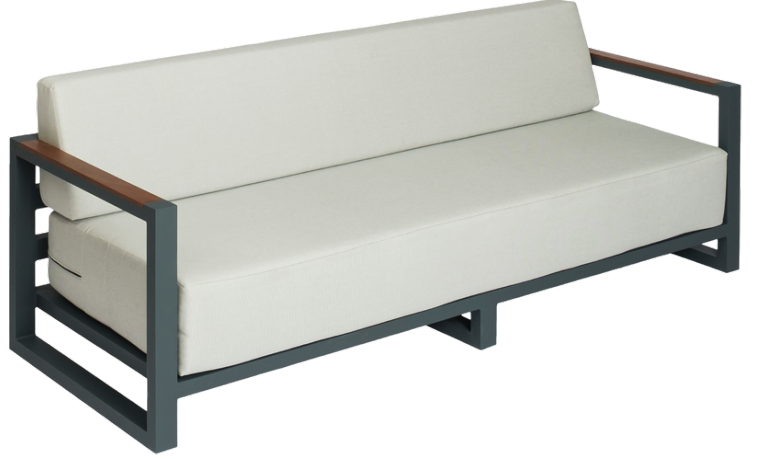
Üçlü Koltuk/Triple Sofa