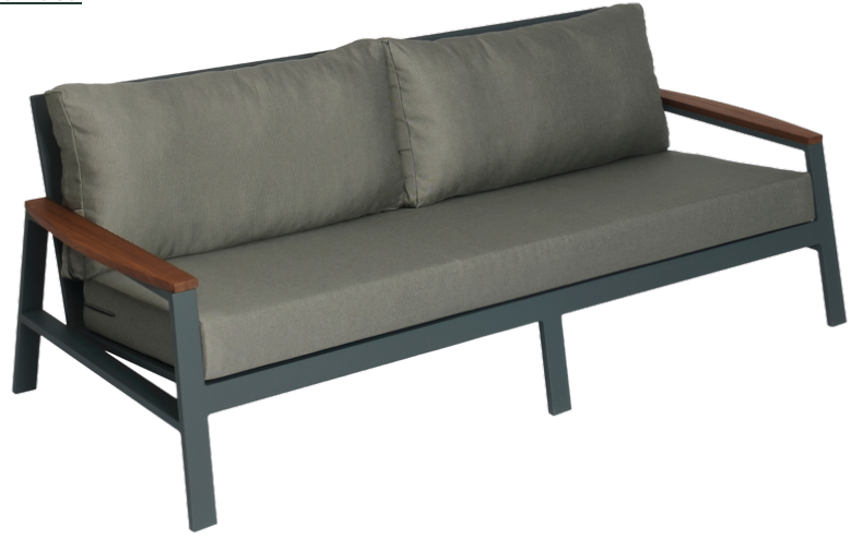
Üçlü Koltuk/Triple Sofa