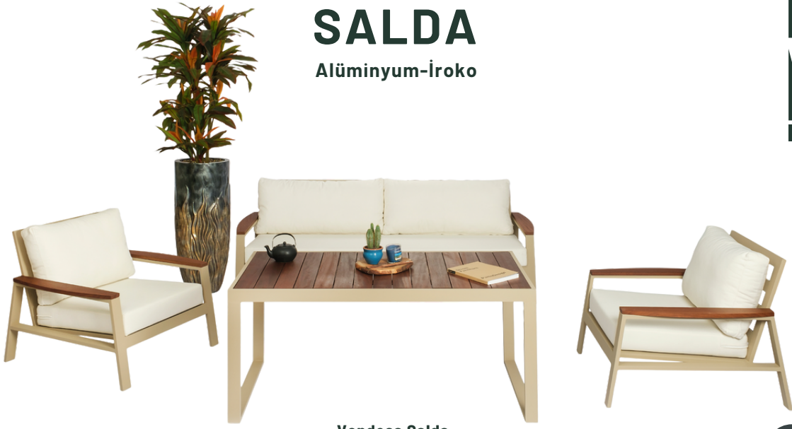
Vondesa Salda 3-1-1 Koltuk Takım İroko Masa