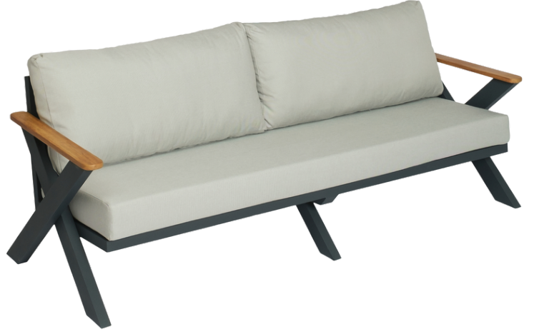
Üçlü Koltuk/Triple Sofa