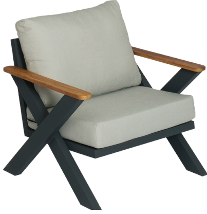
Tekli Koltuk/Single Seat