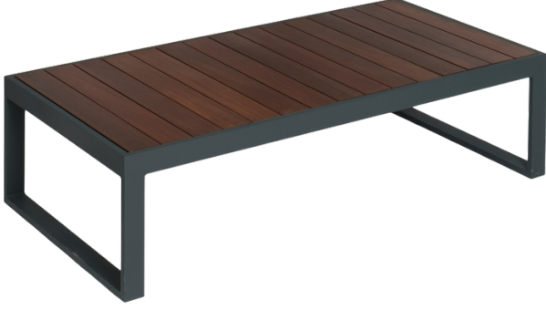
Sehpa(Ahşap Yüzeý)/Coffee Table