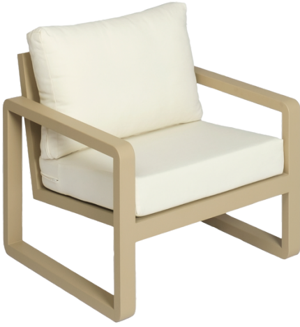
Tekli Koltuk/Single Seat