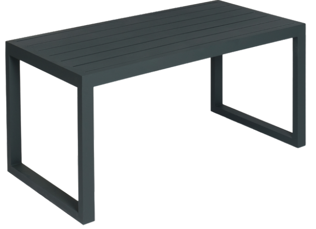
Masa(Alüminyum Yüzeý)/Aluminum Dinner Table