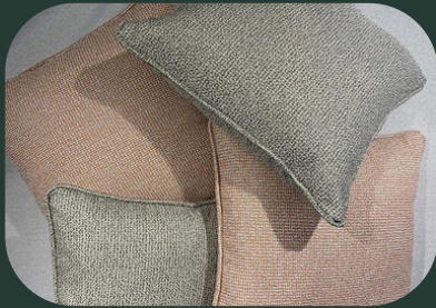
BONCUK SLİKON SIRT YASTIK