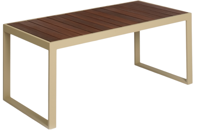
Masa(Ahşap Yüzeý) /Dinner Table