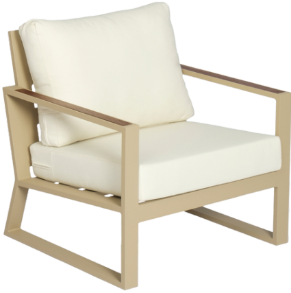
Tekli Koltuk/Single Seat