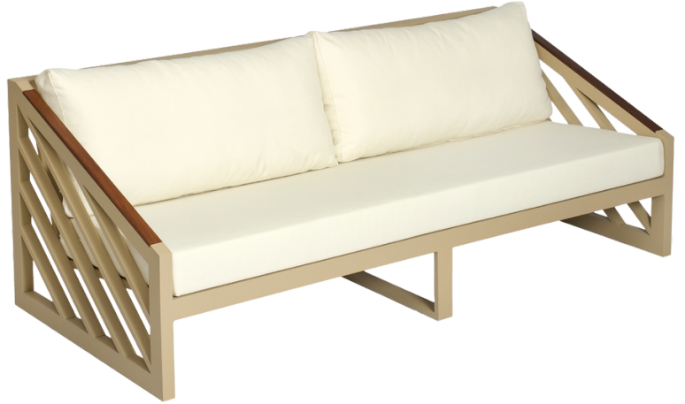
Üçlü Koltuk/Triple Sofa