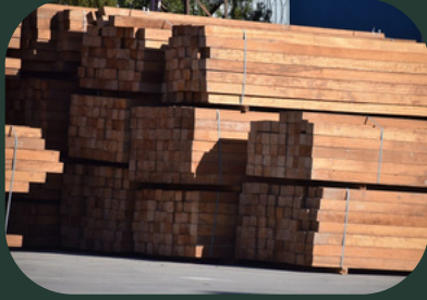
-İROKO AĞAÇ -THERMOWOOD İROKO AĞAÇ