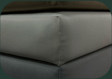
28-35 DANSİTE ELYAF KAPLI SÜNGER