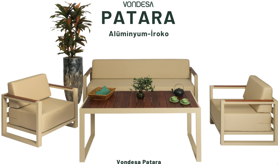
Vondesa Patara 3-1-1 Koltuk Takım İroko Masa