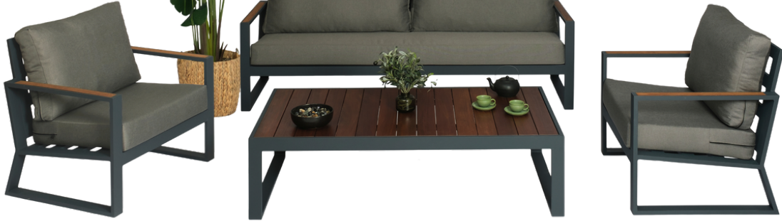
Vondesa Pamukkale 3-1-1 Koltuk Takım İroko Masa