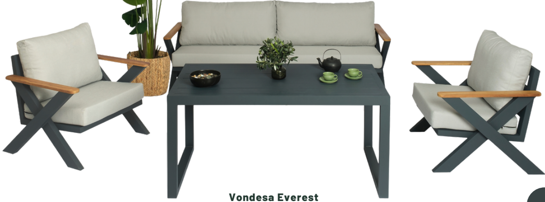
Vondesa Everest 3-1-1 Koltuk Takım Alüminyum Masa