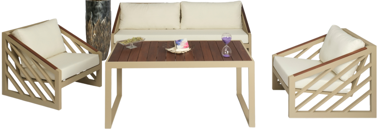
Vondesa Dalyan 3-1-1 Koltuk Takım İroko Masa