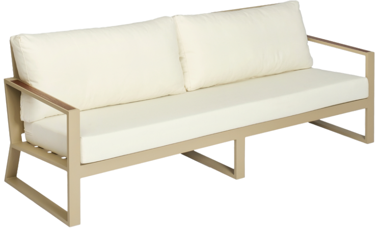
Üçlü Koltuk/Triple Sofa