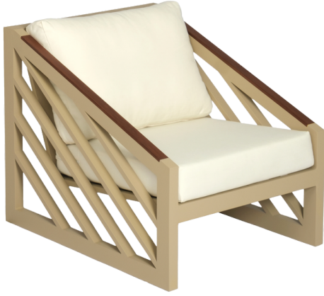
Tekli Koltuk/Single Seat